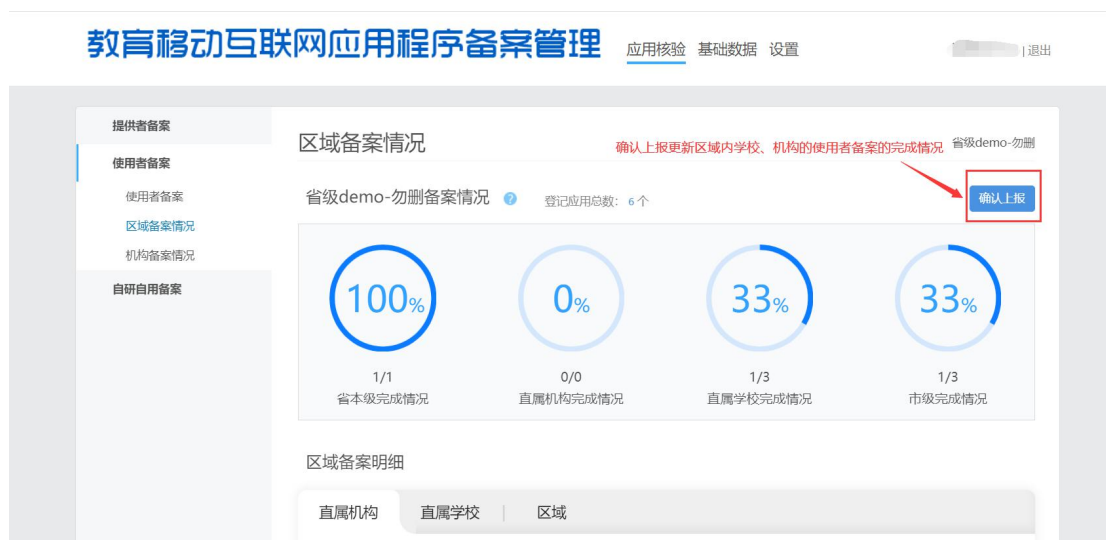
省市区管理员点“确认上报”更新区域内使用者备案完成情况